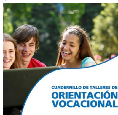
Fig. 5. Portada Cuadernillo de talleres de Orientación Vocacional.

4.5 Se diseñó un cuadernillo de talleres de orientación vocacional (ver figura 5), para estudiantes de grados 10 y 11, que se reprodujo y entregó a 1990 estudiantes, con los siguientes temas: