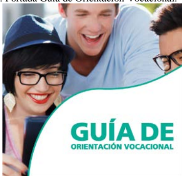
Fig. 4. Portada Guía de Orientación Vocacional.

4.4 Se diseñó una guía de orientación vocacional (ver figura 4) con el siguiente contenido: