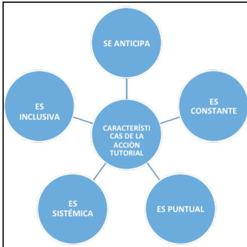
Figura 1: Características de la acción tutorial

En la Figura N°1 se resume las características en la que se fundamenta la tutoría.