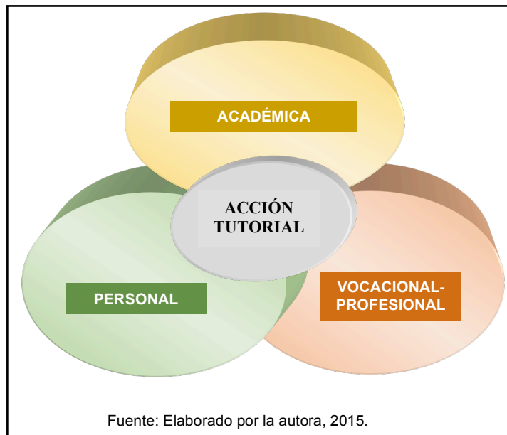
Figura 3 Áreas de acción tutorial

a. Área Académica: La tutoría se define aquí como el proceso de acompañamiento a los estudiantes durante los estudios, para ayudarlos a solucionar problemas educativos, como el bajo rendimiento académico, carencia de técnicas y hábitos de estudios efectivo, poca orientación para enfrentar las prácticas profesionales u otras actividades establecidas en el Plan de Acción Tutorial.